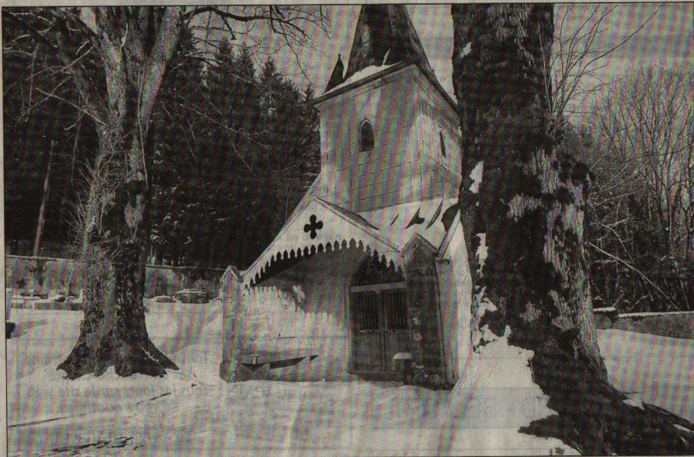
Les deux tilleuls sont dangereux pour les uns, solides et méritant leur place pour les autres.

Un rendez-vous a été pris avec le sous-préfet à Pontarlier pour s'opposer à cet abattage prévu vers le mois d'avril.